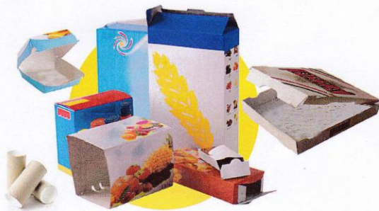
Petits emballages en carton